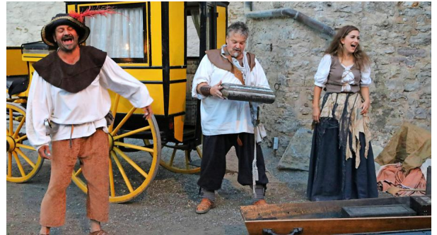
Auftragsüberfall: Die Räuberbande stoppt bei Mäusdorf die Postkutsche und erbeutet Gold, Silber und wichtige Dokumente.