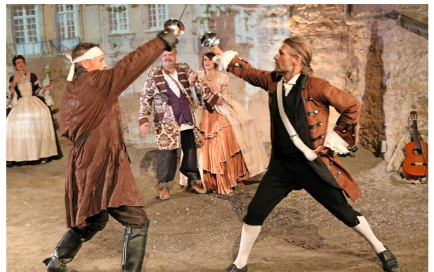
Um Leben und Tod: Der Räuberhauptmann Alexander von Greiffenclau (Jeoma Flors, links) kreuzt mit dem Künzelsauer Schultheiß Faust (Matthias Imarin Cordes) die Klingen.

Künftig soll die Route statt über die Gemarkung der Herren von Stetten über Kirchberg und damit über seine Straßen führen. Von politischer Bedeutung im Reich wird der Überfall, weil ein hochrangiger polnischer Diplomat in der Kutsche sitzt. "Ihn malträtiert, aber nicht töten", lautet